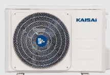
Kültéri egység KNP